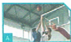
3. Basketball spielen