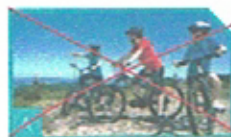
5. Schulsport machen