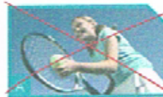
2. Badminton spielen