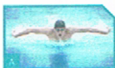
1. Wassersport machen

3. Przekreśl zdjęcie niepasujące do wyrażenia.