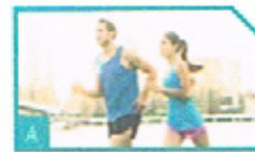
4. aktiv sein