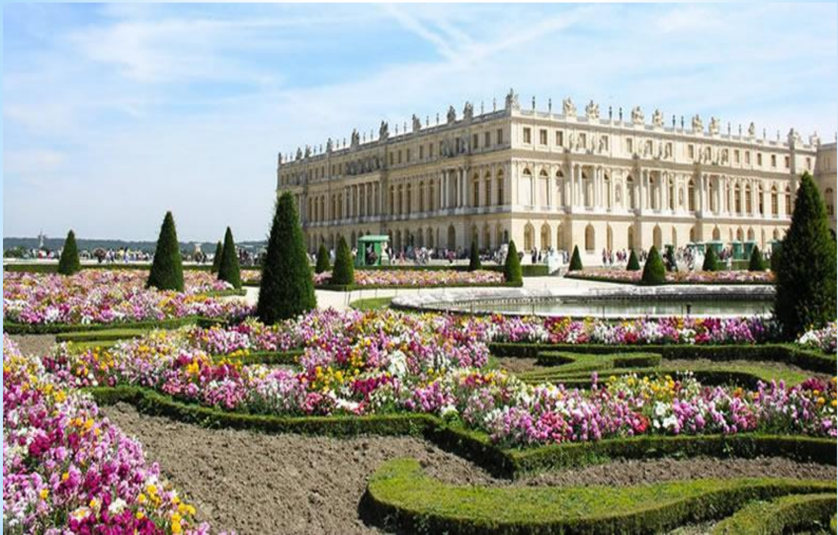
Pałac Wersalski rezydencja królów francuskich.