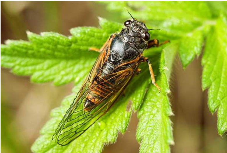
Piewik - cykada