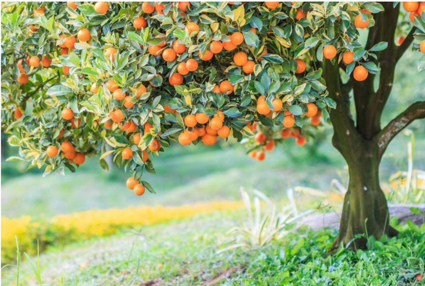
Sady owoców cytrusowych

Ludność poza turystyką zajmuje się również rolnictwem , głównie sadownictwem.