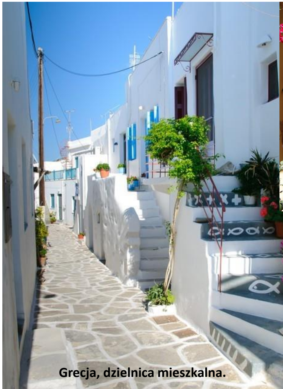
Grecja, dzielnica mieszkalna.